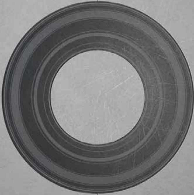
GRIGIO (● NERO)