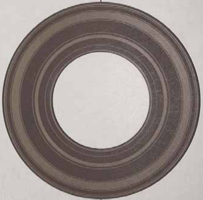
AVORIO (● MOKA)