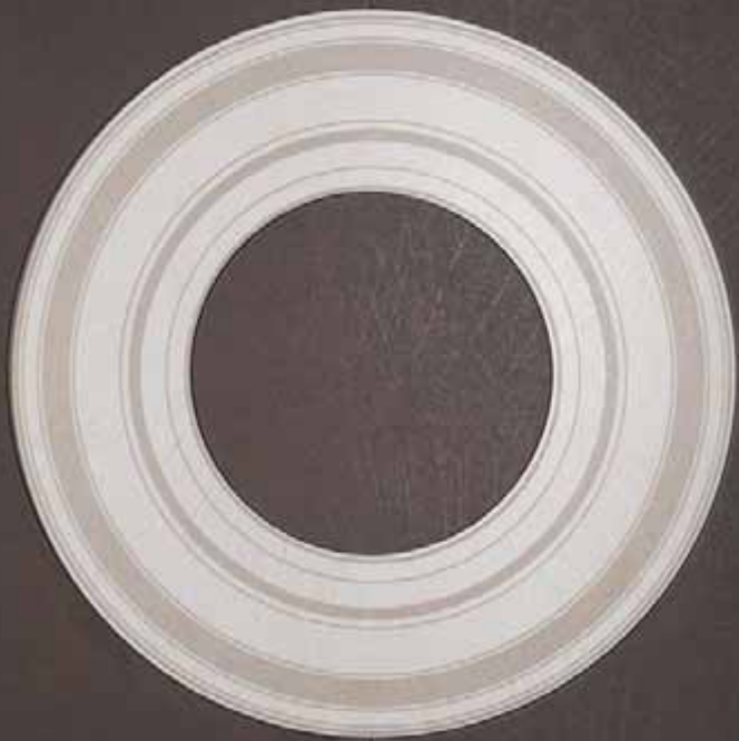
MOKA (● AVORIO)